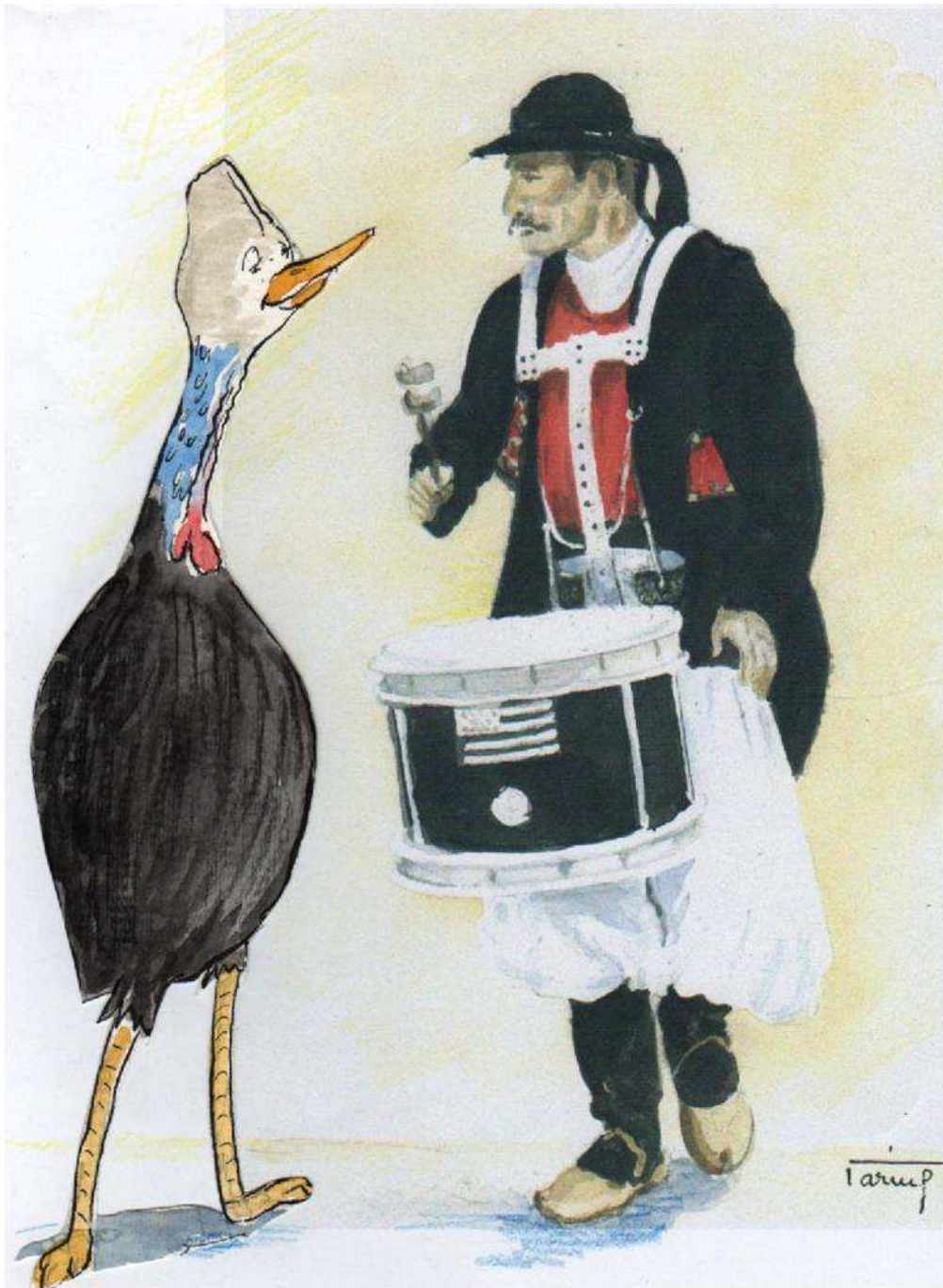
MUSIC 2 (La Paimpolaise)